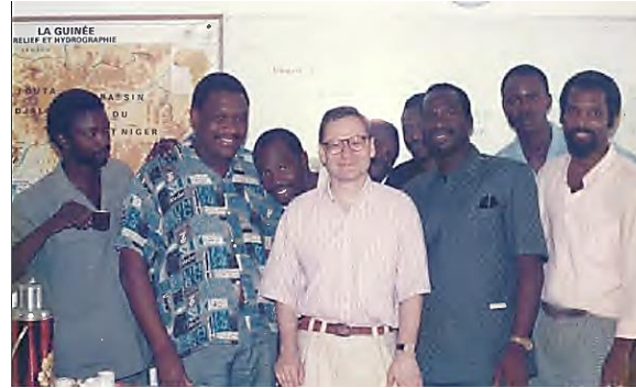
Mission PNUD à Conakry (Guinée), 1991. Programme d'Appui à la Gestion de l'Economie Guinéenne. Expertise et formation de la haute administration préfectorale.