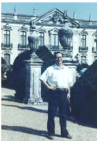
Colloque de l'ASRDLF, Lisbonne, 1987. (Photo prise au Château de Queluz par Jean-Claude Perrin).