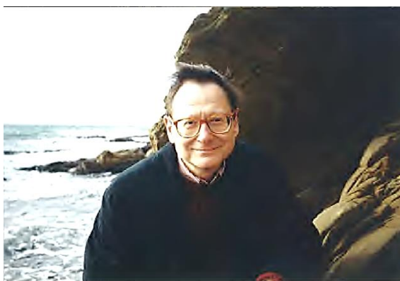
Au Fort de Brégançon, 2000.