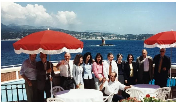
Colloque de l'Association Tiers-Monde, Ile de Bendor, Bandol (Var) organisé les 27 et 28 mai 1998.