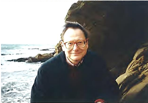
Au Fort de Brégançon, 2000.