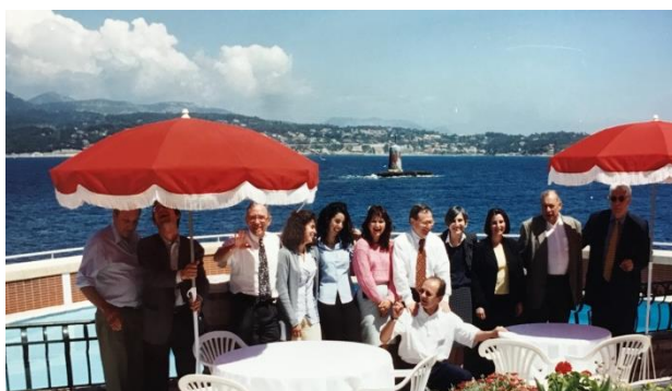
Colloque de l'Association Tiers-Monde, Ile de Bendor, Bandol (Var) organisé les 27 et 28 mai 1998.