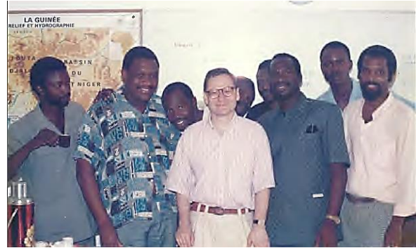
Mission PNUD à Conakry (Guinée), 1991. Programme d'Appui à la Gestion de l'Economie Guinéenne. Expertise et formation de la haute administration préfectorale.