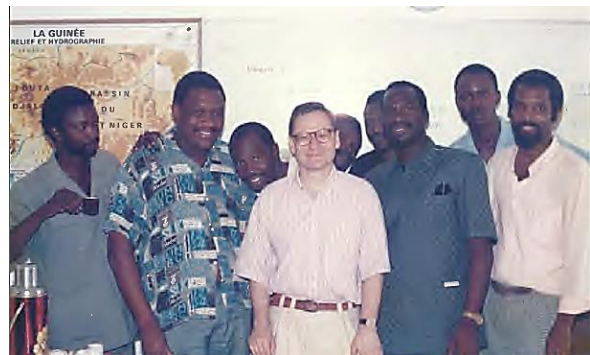
Mission PNUD à Conakry (Guinée), 1991. Programme d'Appui à la Gestion de l'Economie Guinéenne. Expertise et formation de la haute administration préfectorale.