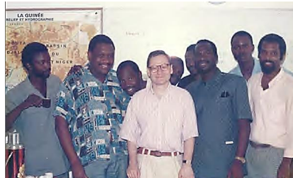
Mission PNUD à Conakry (Guinée), 1991. Programme d'Appui à la Gestion de l'Economie Guinéenne. Expertise et formation de la haute administration préfectorale.