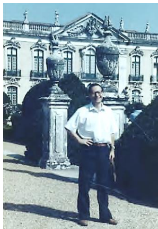
Colloque de l'ASRDLF, Lisbonne, 1987.