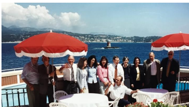
Colloque de l'Association Tiers-Monde, Ile de Bendor, Bandol (Var) organisé les 27 et 28 mai 1998.