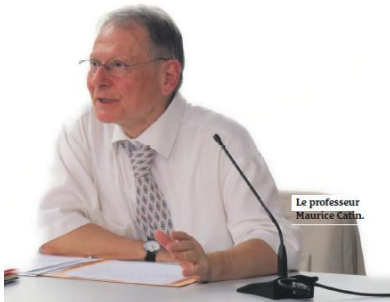
Article dans Tpbm sur la conférence « Toulon, un virage métropolitain », Journée inaugurale du pôle universitaire Porte d'Italie, Toulon, octobre 2014.