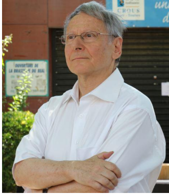
Article dans L'Express, Cahier spécial sur Toulon, 13 avril 2016.