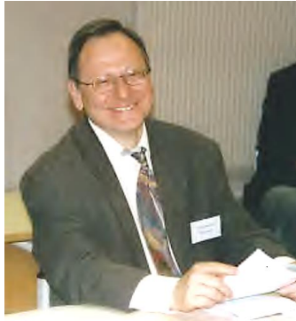
Journées ATM, mai 2004, Nancy (Photo prise par Jean Brot).